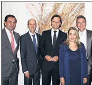
Kamingsgespräch bei Eustacchio & Schaar.