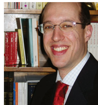
Autor Dr. Andreas Eustacchio, LL.M.: "Die Tücken der Produkthaftung liegen im Detail, weil es für Unternehmer und Konsumenten keine eindeutige Richtschnur dafür gibt, was alles unter einem Produktfehler zu verstehen ist."

Händler haften "subsidiär" für die von Ihnen vertriebenen Produkte, und zwar dann, wenn es ihnen nicht gelingt, dem Geschädigten den tatsächlichen Hersteller, den Importeur oder den Vorlieferanten des Produkts in angemessener Zeit zu nennen. Begründet jedoch der Händler beim Verbrau-